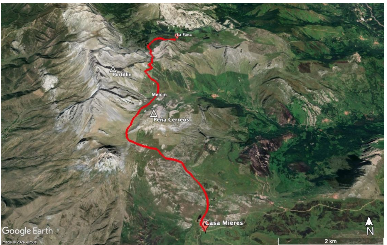
Fig. 3. Trazo de la marcha majada de La Fana-Casa de Mieres.

16:30 Llegada a Vega de Los Navares , Casa de Mieres.