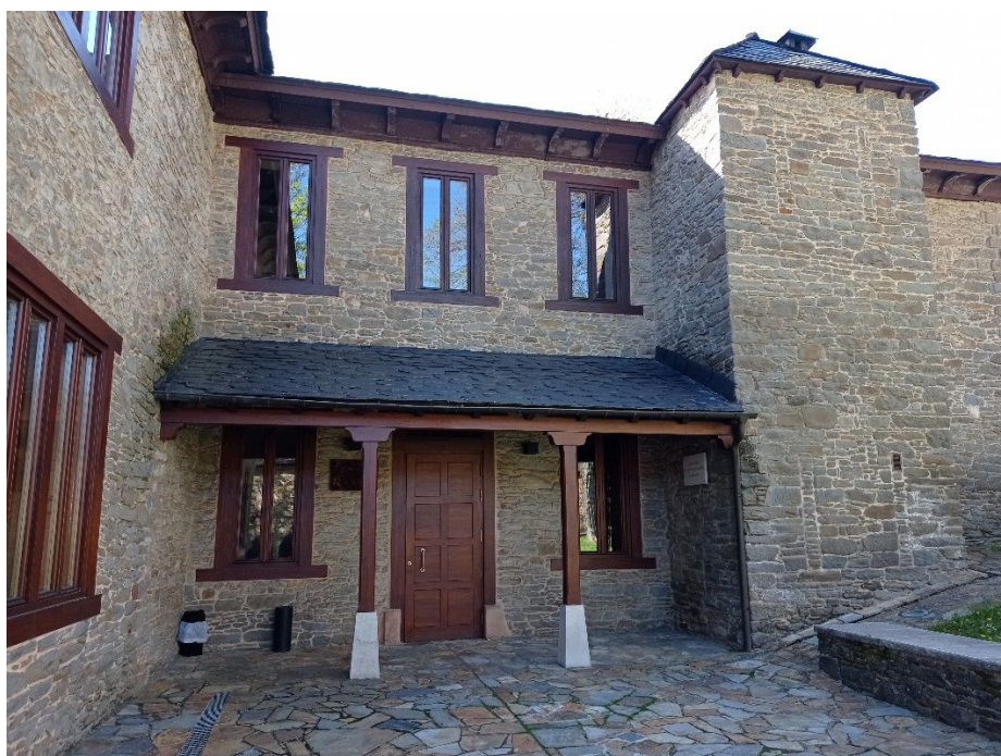
Figura 7 . Edificio de la Fundación Sierra Pambley en Villablino

21:00 Cena ofrecida por la Fundación Sierra Pambley