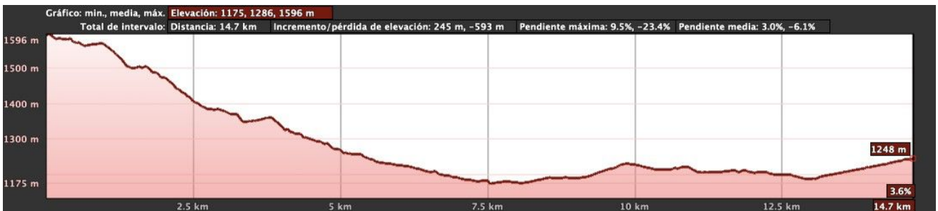
Fig. 6. Perfil de la marcha Casa de Mieres, Puerto de Pinos-Riolago