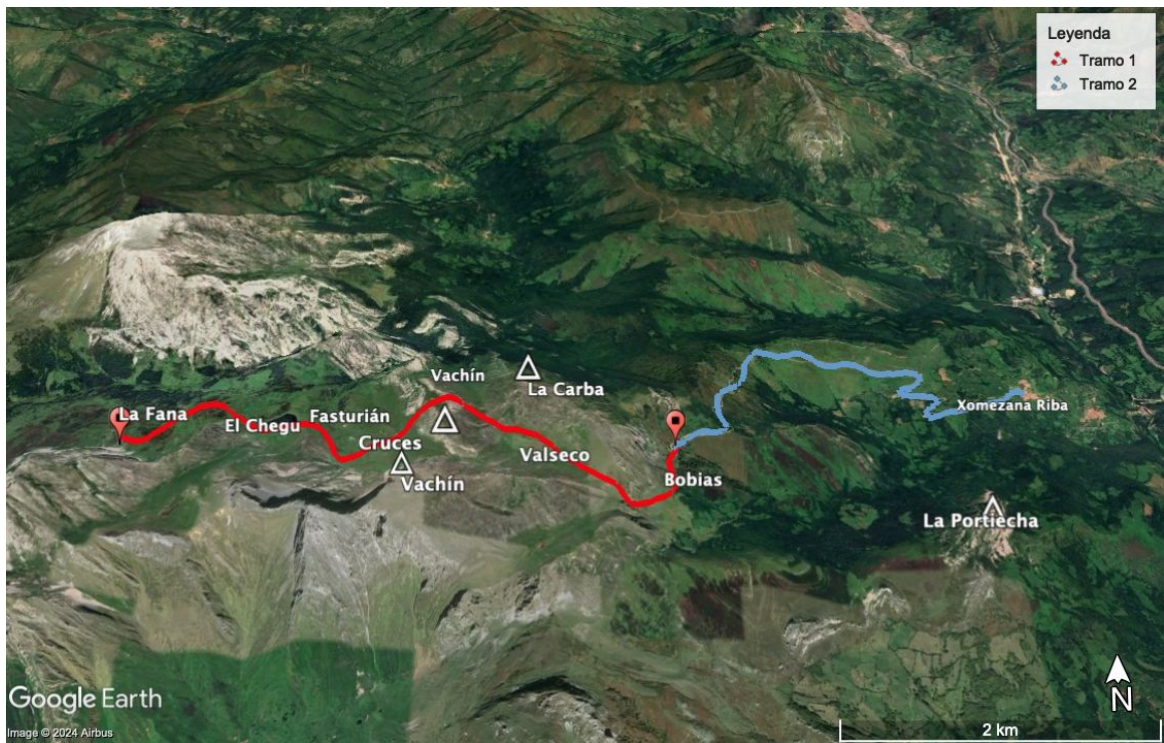
Fig. 1. Trazo de la marcha Xomezana Riba, El Chegu, La Fana