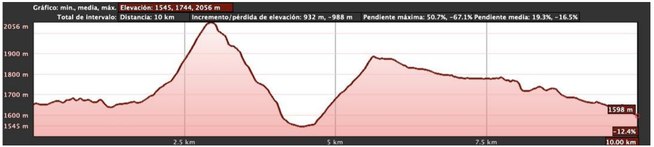
Fig. 4. Perfil de la marcha majada de La Fana –Casa de Mieres