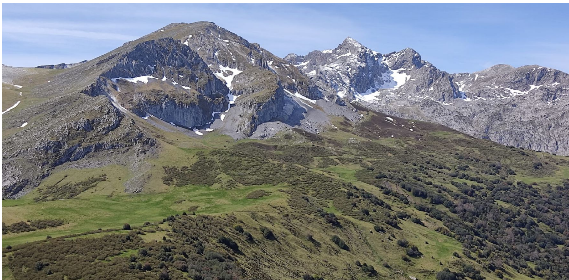
Fig.3. Las majadas el Chegu, en primer término, y La Fana debajo del Fariñentu.

16:30 Instalación del CGI en la majada de La Fana, puertos de Güeria