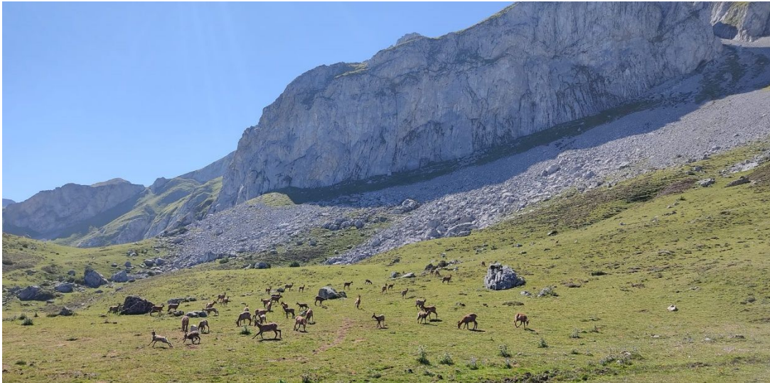
Figura 3. La majada de La Fana, llena de rebecos.