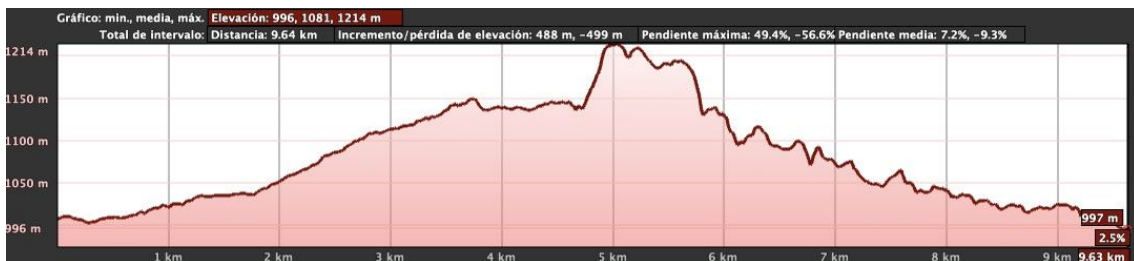
Fig. 8 Perfil de la marcha a pie por la ruta de los Texas (Rioscuro- Brañarronda) en su recorrido máximo, que siendo circular se acortará a una duración que no superará las tres horas.