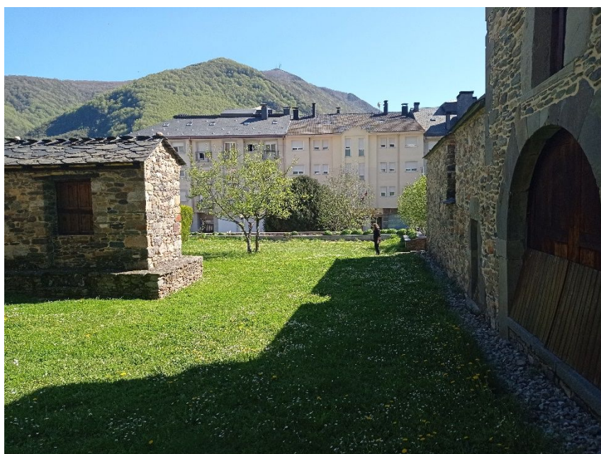
Figura 8 . Huerta de la Fundación Sierra Pambley en Villablino, donde se acampará