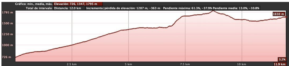
Fig. 2. Perfil de la marcha Xomezana Riba, Bobias, Valseco, El Chegu, La Fana

16:30 Instalación del CGI en la majada de La Fana, puertos de Güeria