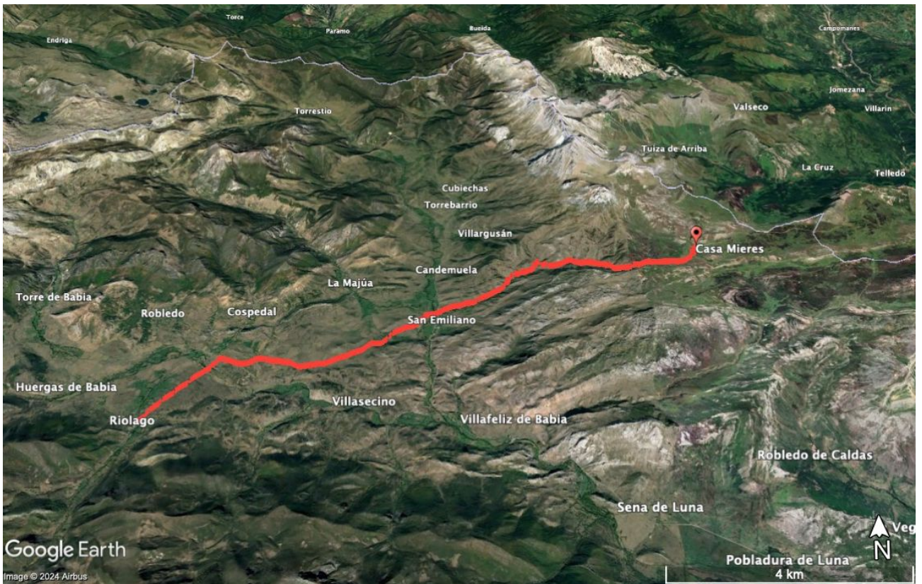
Fig. 5. Trazo de la marcha Casa de Mieres, Puerto de Pinos-Riolago